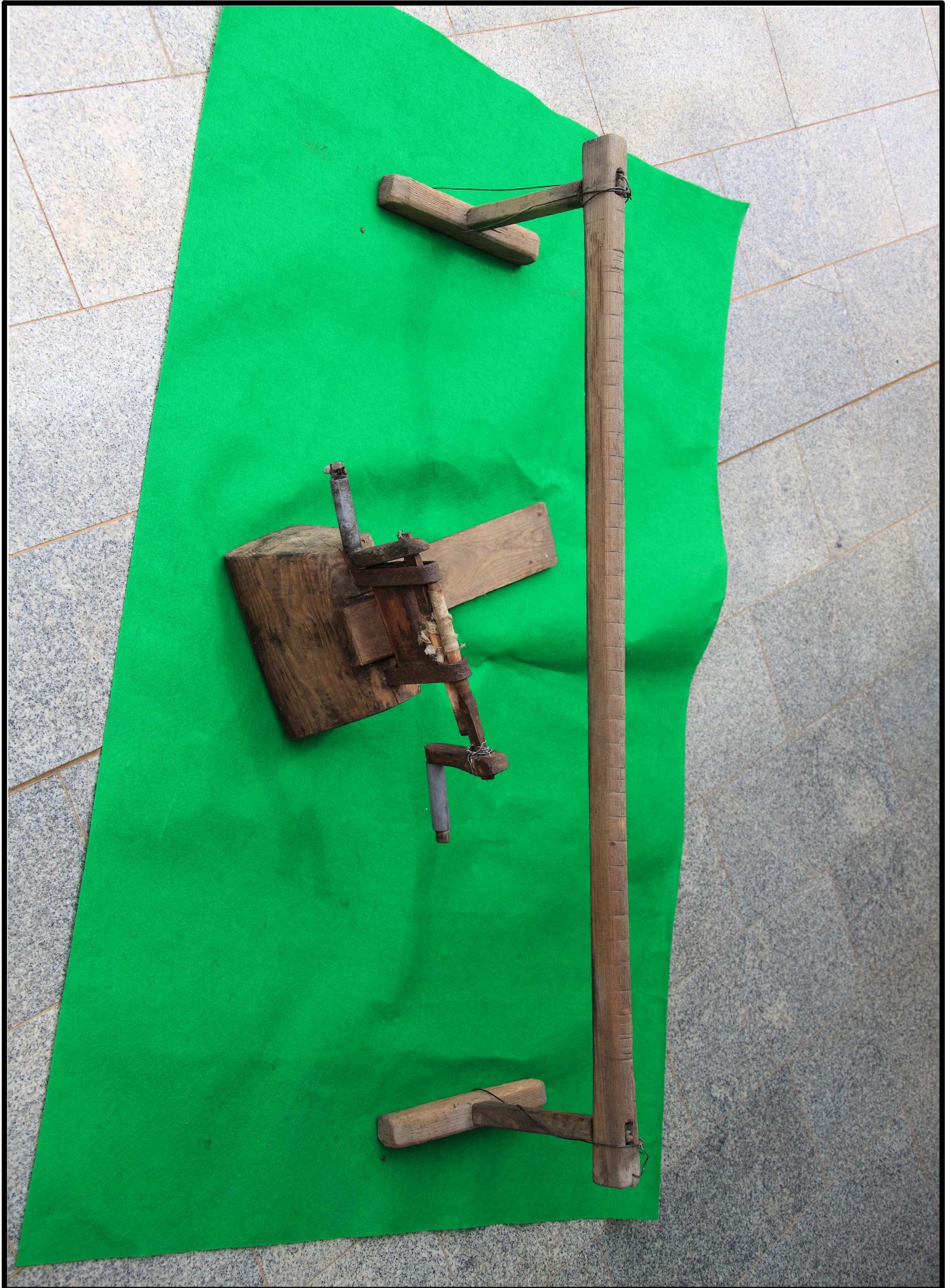
< 자리틀, 씨아 >