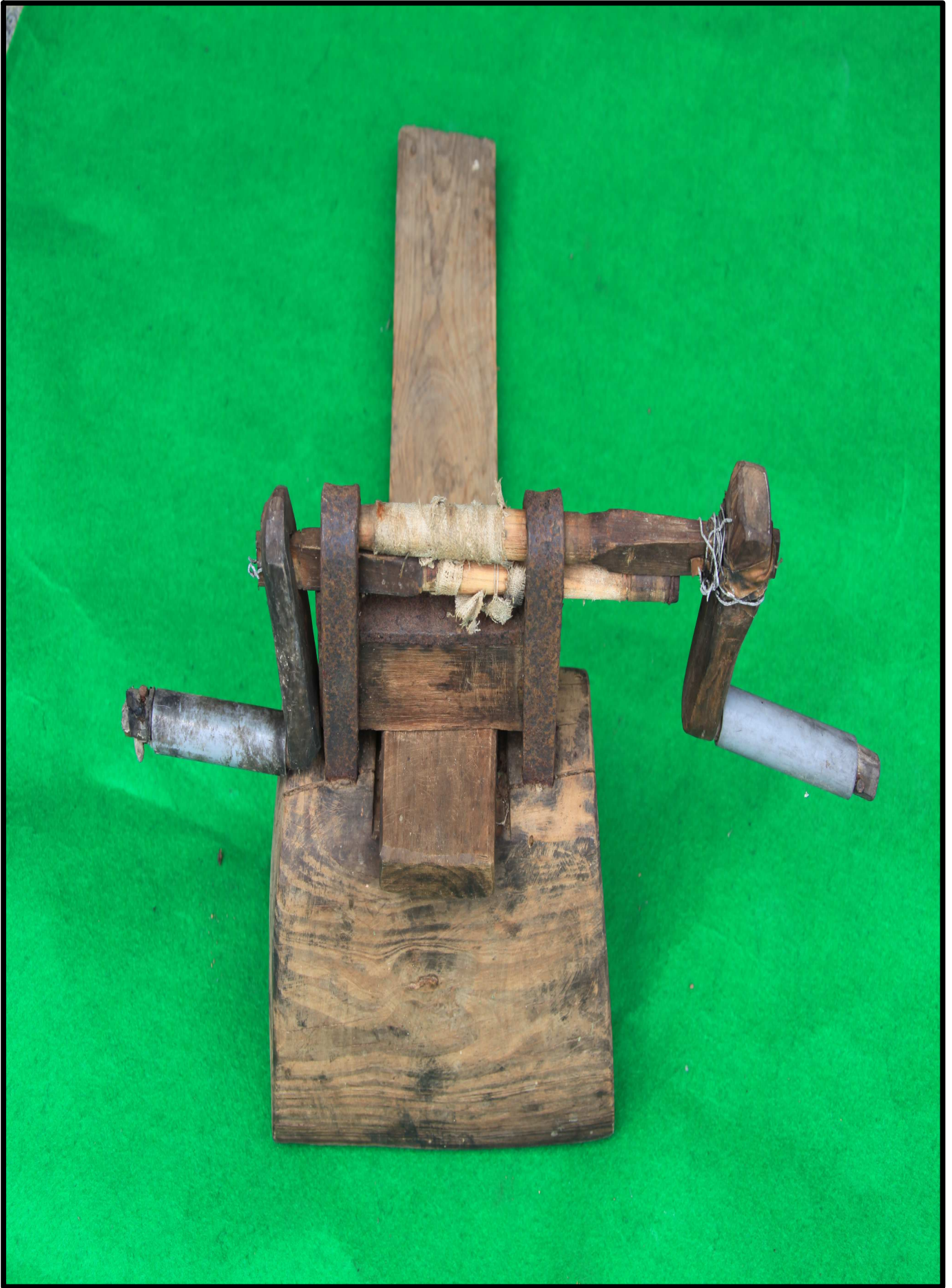
< 씨아 뒤 >