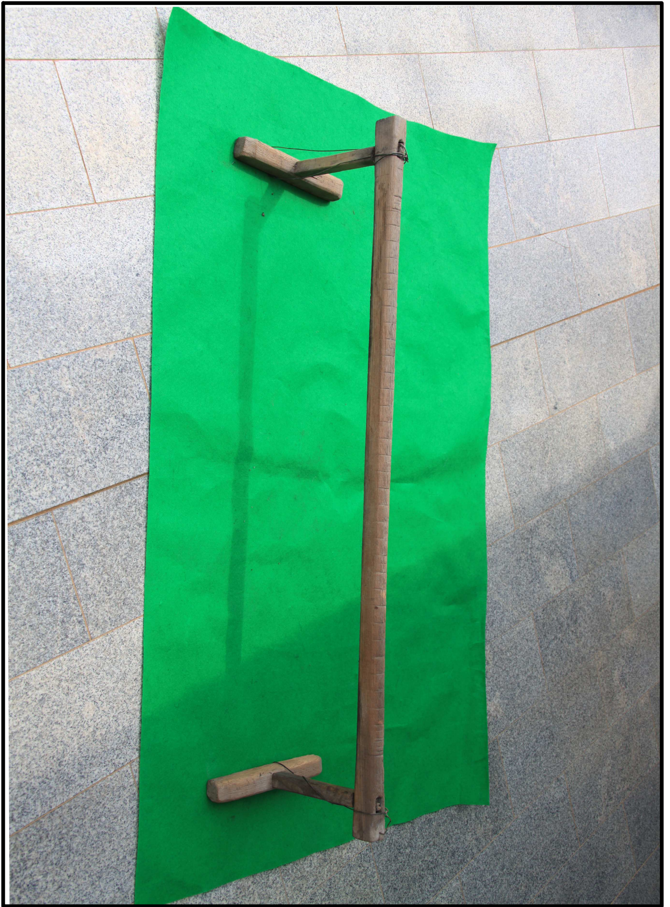
< 자리틀 >