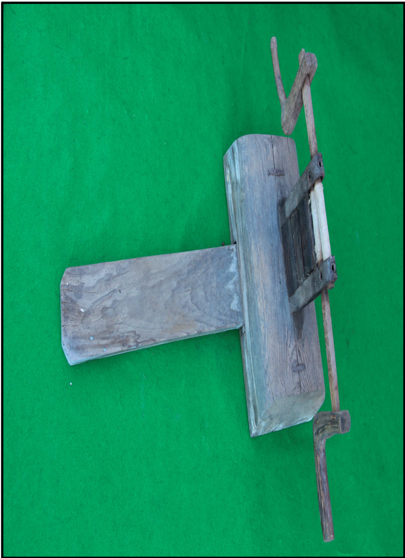
< 씨아-2 >