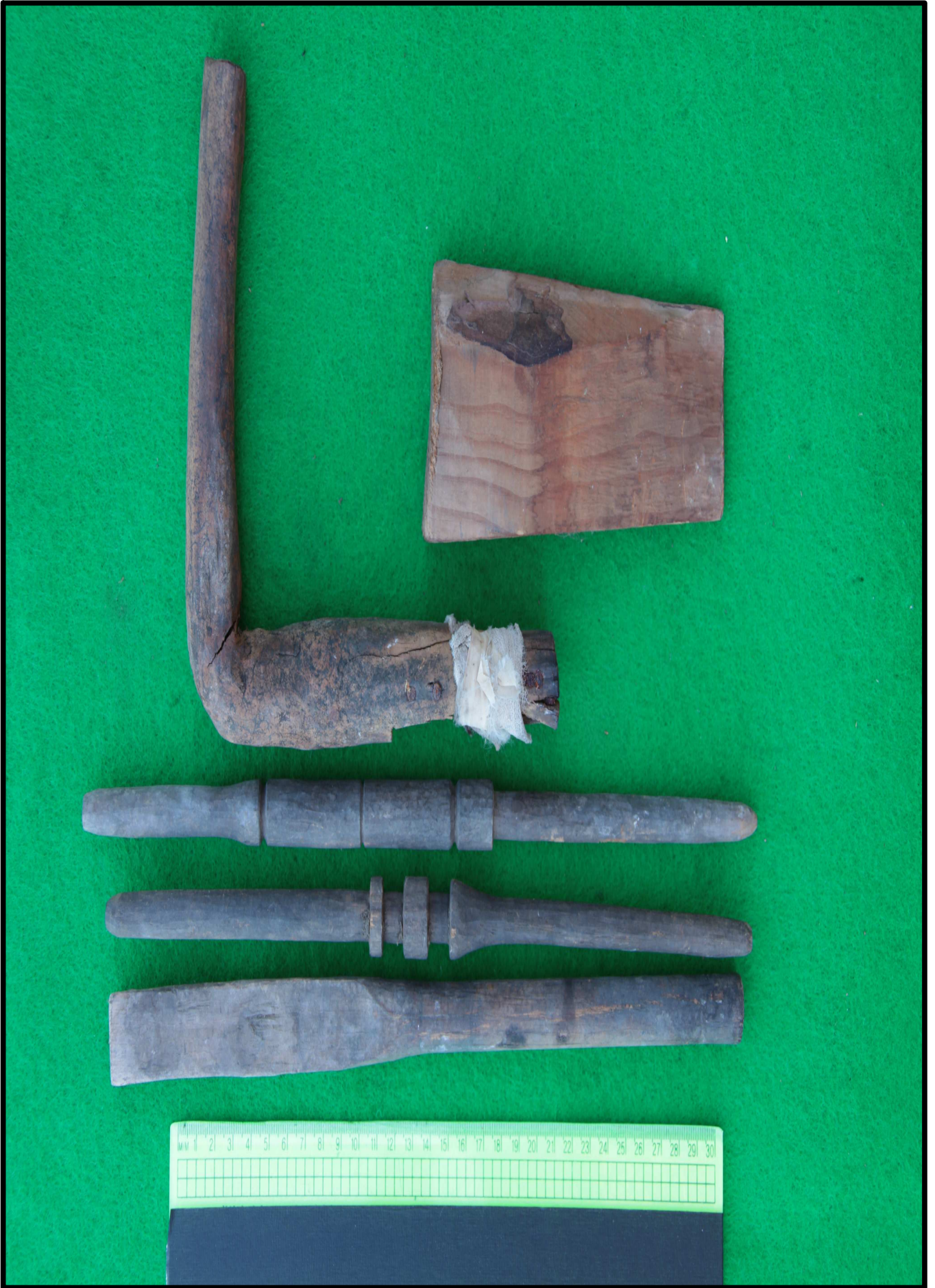
< 씨아보조도구 >